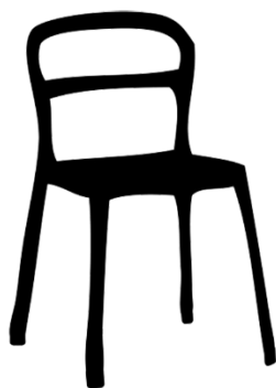
Obrázek 6 Figura pro rozdělení do skupiny Dřevařské společnosti