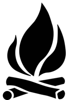
Obrázek 7 Figura pro rozdělení do skupiny Domorodců z kmene Awá

Zastupujete domorodce z kmene Awé. Domorodci z kmene Awé žijí v rezervaci, kde je omezená těžba. K výstavbě obydlí, zbraní a pro palivové dříví jim stačí každý rok pokácet jeden strom. Jejich zájmem je žít tak jako jejich předci mimo civilizaci a v souladu s pralesem. Prales je jejich zdrojem obživy, potřebují ho k životu a potřebují, aby byl zachován.