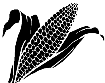
Obrázek 5 Figura pro rozdělení do skupiny Novo-osídlenci

Zastupujete novo-osídlence, kteří se nově přestěhovali na okraj pralesa. Novo-osídlenci jsou farmáři a pěstují zeleninu a kukuřici, na pozemcích, které dostali od vlády. Někteří osadníci si se svými poli vystačí, někteří by chtěli prodávat zeleninu a rozšiřovat svá pole. Každý rok mohou vykácet 2 stromy. Pokud se domluví s jinou skupinou, mohou vykácet více stromů a rozšířit svá pole.