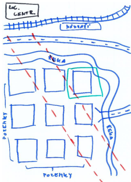
Obrázek 2 Mapa s náčrtem koridoru pro čtyřproudou silnici vedoucí přes lokalitu, kde žijí postavy z příběhu.

Žáci sedí v kruhu a lektor pokračuje v příběhu postav, které se po dvou letech soužití musí vypořádat s novým problémem: Postavy společně spokojeně žijí 2 roky, po dvou letech se ale objeví zpráva, že přes jejich čtvrt těsně kolem jejich domu má vzniknout čtyřproudá silnice vedoucí k logistickému centru u nádraží (viz obrázek 2).