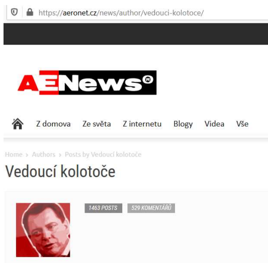
Obrázek 9 Popis autora článků na zpravodajském webu Aeronet.cz