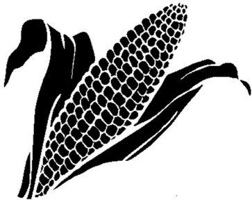
Obrázek 5 Figura pro rozdělení do skupiny Novo-osídlenci

Zastupujete novo-osídlence, kteří se nově přestěhovali na okraj pralesa. Novo-osídlenci jsou farmáři a pěstují zeleninu a kukuřici na pozemcích, které dostali od vlády. Někteří osadníci si se svými poli vystačí, někteří by chtěli prodávat zeleninu a rozšiřovat svá pole. Každý rok mohou vykácet 2 stromy. Pokud se domluví s jinou skupinou, mohou vykácet více stromů a rozšířit svá pole.