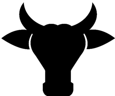
Obrázek 4 Figura pro rozdělení do skupinky Chovatelé dobytka

Zastupujete místní chovatele dobytka. Jejich zájmem je kácet stromy, aby rozšířily pastviny pro chov svého dobytka. Každý rok máte právo na to vykácet 3 stromy. Rozšiřování pastvin můžete kdykoliv omezit.